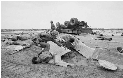
Hình chụp một chiến sĩ Việt Nam Cộng Hoà đang cố cứu một người dân bị thương vì xe chở họ bị mìn nổ ở Quảng Trị.

Thân mời quý Thân Hữu, quý Hội Viên và gia đình đến tham dự buổi lễ 30 tháng 4 này để tưởng niệm và tri ân các chiến sĩ, đồng bào cùng những anh hùng đã đấu tranh và hy sinh cho sự tồn vinh và tự do của con dân Việt Nam.